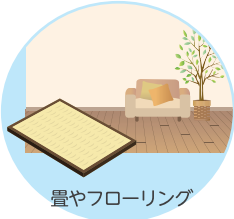
畳やフローリング