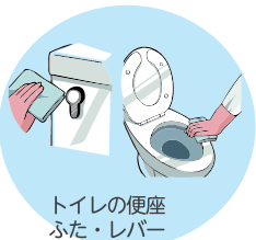
トイレの便座 ふた・レバー

飲食店、学校、介護施設、宿泊施設、オフィス スーパー、カラオケ店、共用トイレなどの ウイルス・飛沫対策に！