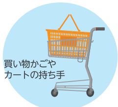
買い物かご カートの持ち手