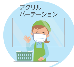
アクリルパーテーション